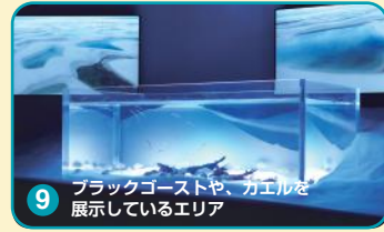
9 ブラックゴーストや、ガエルを展示しているエリア

ブラジルに広がる真っ白な砂丘を再現しています。南アメリカに生息するカエルたちも展示しています。