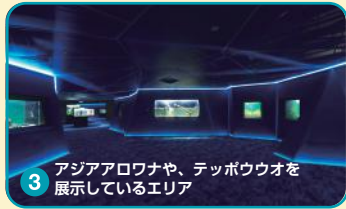
3 アジアアロワナや、テッポウオを展示しているエリア