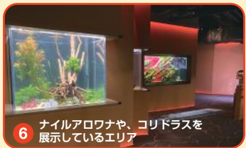
6 ナイルアロワナや、コリドラスを展示しているエリア