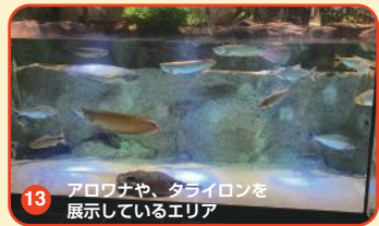
13 アロワナや、タイロンを展示しているエリア