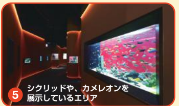
5 シクリッドや、カメレオンを展示しているエリア

アフリカンシクリッドやカメレオン、ハイギョなど不思議な生きものたちが展示されています。