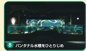
8 パンタナル水槽をひとりじめ