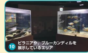
10 ピラニアや、ブルーカンディルを展示しているエリア

予備水槽やろ過ポンプなど、普段は見ることのできない水族館の裏側を公開しています。バックヤードツアーも開催しています。