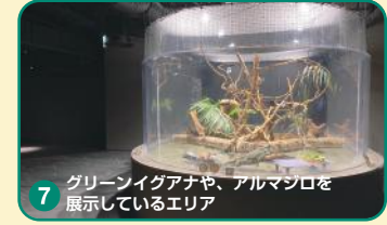
7 グリーンイグアナや、アルマジロを展示しているエリア

グリーンイグアナや、コモンマーモセットを展示しています。運が良ければ、寝起きのマタコミツオビアルマジロもご覧いただけます。