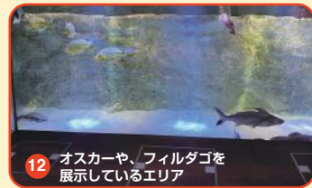
12 オスカーや、フィルダゴを展示しているエリア