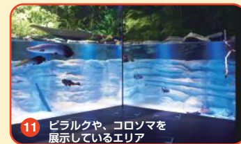
11 ピラルクや、コロソマを展示しているエリア

ジャングルに迷い込んだかのような空間を再現し、ピラルクなどの魚に加え、カピバラやナマケモノなど様々な生きものを展示しています。