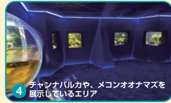
4 チャンナバルカや、メコンオオナマスを展示しているエリア