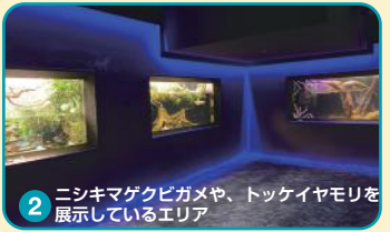
2 ニシキマゲクビガメや、トッケイヤモリを展示しているエリア

アロワナ、トッケイヤモリ、ワライカワセミなどオセアニア・アジアの多種多様な生きものを展示しています。