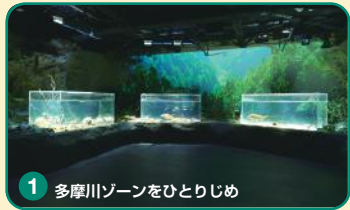
1 多摩川ゾーンをひとりじめ

地元川崎を流れる多摩川の生きものたちを上流・中流・下流などにわけて展示しています。